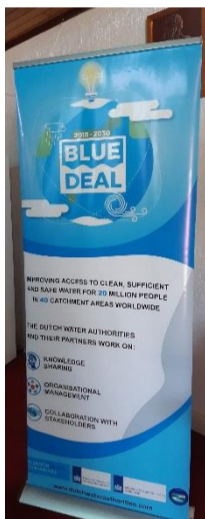
Kijk de terugblik op de inauguratie van het Lower Volta bestuur