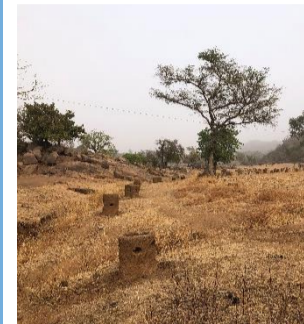
Kijk de dronebeelden van het reforestation project

Onze ervaring is dat verbetering van de governance en capaciteitsversterking enorm gebaat zijn met het tegelijkertijd uitvoeren van laagdrempelige "Nature Based" projecten zoals Reforestation. Naast een daadwerkelijke fysieke verbetering geeft dit soort type projecten ook een sterke impuls aan de samenwerking tussen stakeholders, de implementatie van IWRM, het werken met het concept van "gebiedsgerichte aanpak" en het creëren van een gezamenlijke weg vooruit met alle stakeholders.